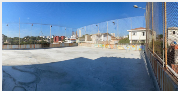
Reforma do Bloco I - Fase 1 concluída

A convivência e o fortalecimento de vínculos, por meio de atividades socioeducativas oferecidas no contraturno escolar, são essenciais para desenvolver as habilidades socioemocionais das crianças e adolescentes, ao mesmo tempo em que ampliam seu repertório cultural. No CCA|Centro para Crianças e Adolescentes, os jovens são incentivados a assumir o protagonismo de suas próprias vidas, adquirindo consciência de seus direitos e responsabilidades, e reconhecendo seu papel na sociedade como cidadãos ativos.